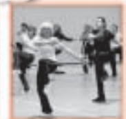
Bauch - Beine - Po