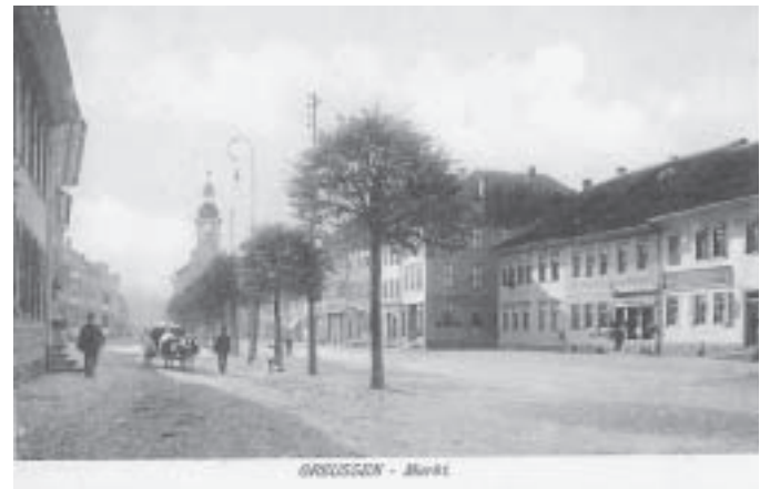
GREUSSEN - Markt

als auch im Steinweg gab es viele Geschäfte, die für das leibliche Wohl und die Versorgung der Bürger von „Kopf bis Fuß“ zuständig, waren. Gemeint sind Lebensmittelläden, Fleischer, Bäcker, Gastwirtschaften sowie solche, die Hüte, Mützen, Bekleidung und Schuhe anfertigten und verkauften. Deren Anteil betrug fast 75% aller hier aufgeführten Geschäfte. Mehrere große „Waren- bzw. Einkaufshäuser“ boten ihre Waren direkt auf dem Markt an. So die Webwarenhandlung Arthur Heinrich in Nr. 10,